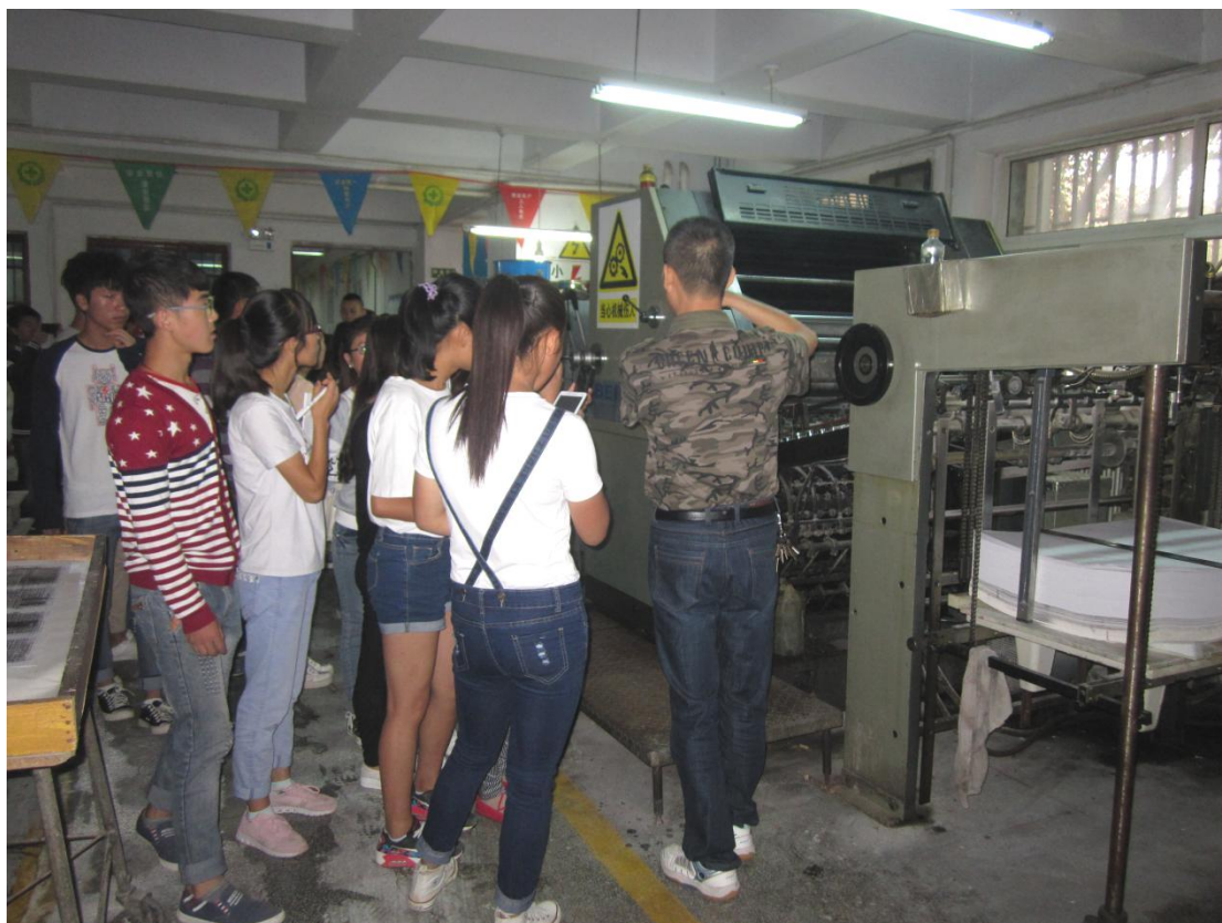
中核彩印刷厂师傅给学生讲解印刷装订知识