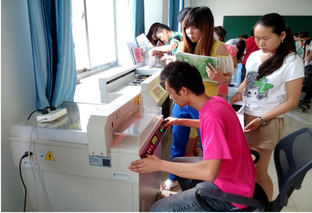
广告设计与制作实训室实训现场