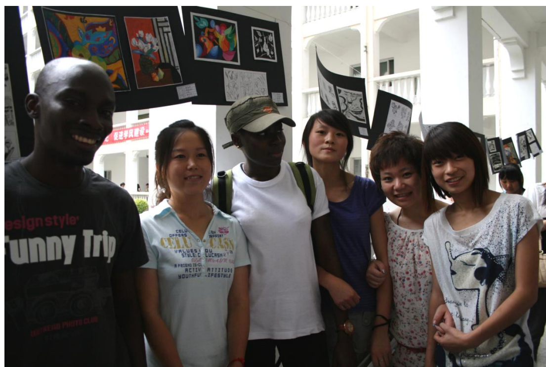
实训课程汇报展览现场