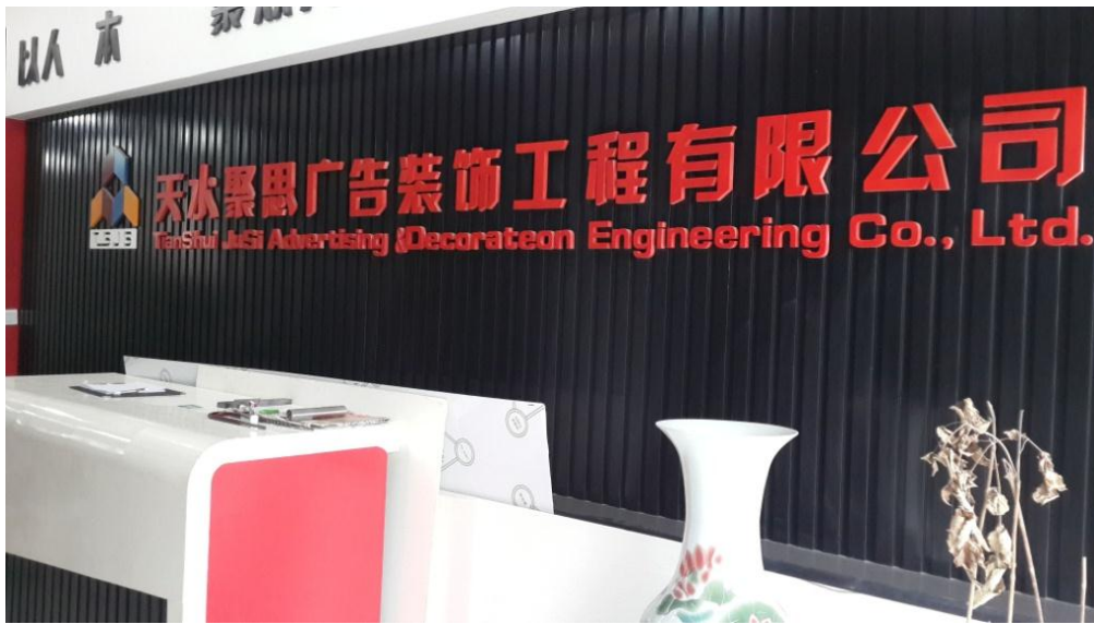
对外服务平台——聚思广告装饰工程有限责任公司