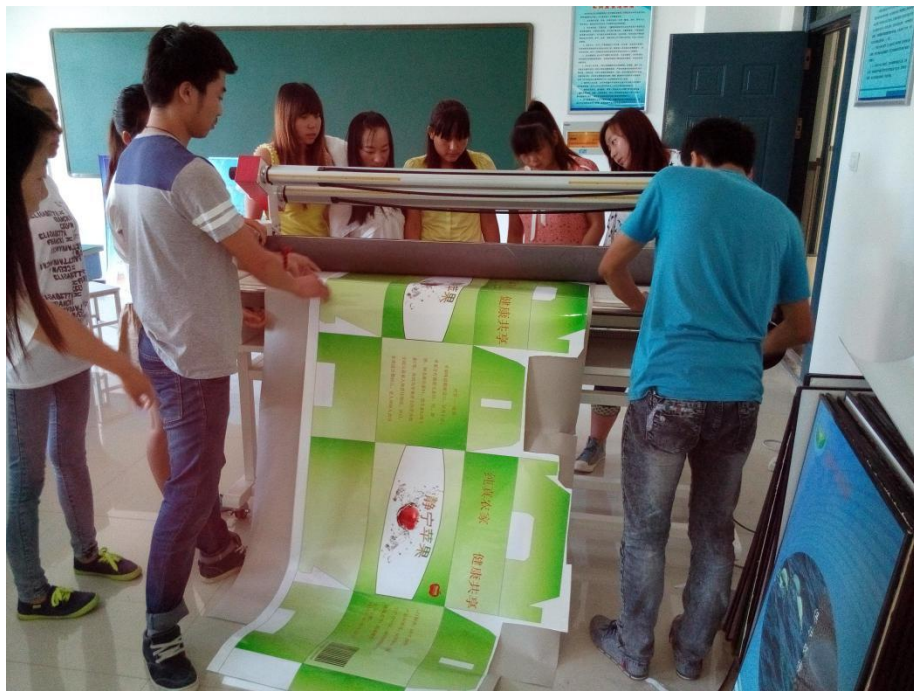
广告设计与制作实训室实训现场