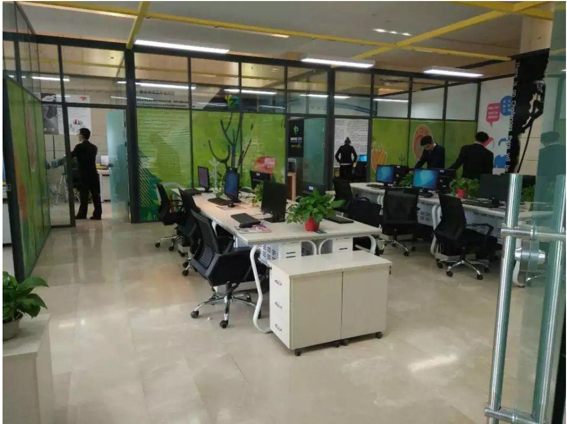
学生在校外实习基地“甘肃中山创意丝绸之路文化传播有限公司”参加顶岗实习