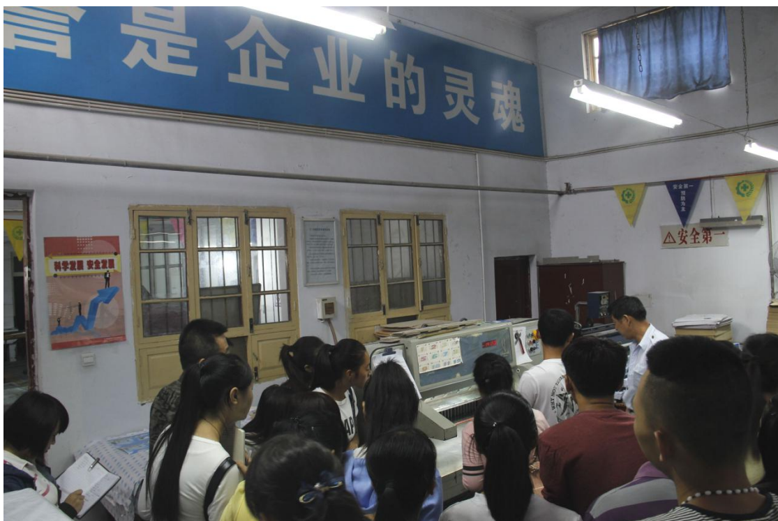
学生在校外实训基地参观学习