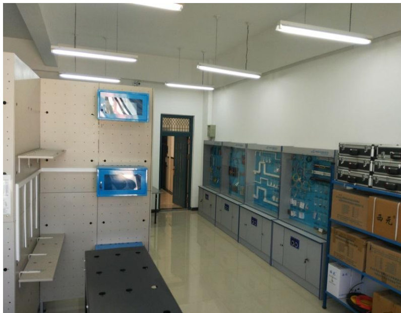
图 7-3 综合布线实训室

验。可完成由 VRP 基础操作、路由协议原理、以太网技术、广域网技术、网络安全技术等实验实训。