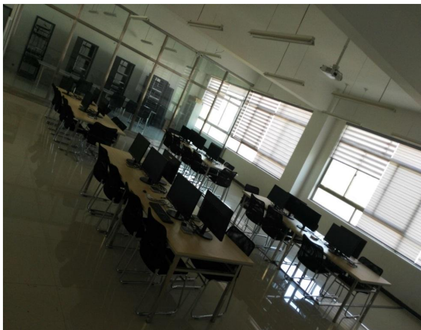
图 7-1 云存储实训室

该实训室主要用于云服务器硬件安装、云操作系统安装、云终端硬件安装、云终端软件安装、云存储配置、虚拟机景象制作、虚拟机的创建和发放等实验实训。